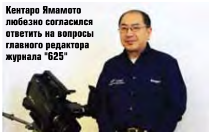
Кентаро Ямамото любезно согласился ответить на вопросы главного редактора журнала "625"